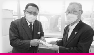
住友生命保険相互会社 鳥取支社 様