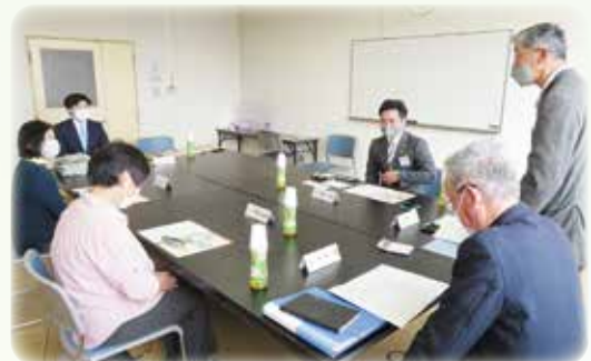
植田委員長を中心に、意見が交わされました。