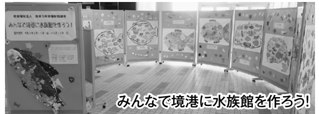
みんなで境港に水族館を作ろう!

赤い羽根共同募金の実績 4,272千円 歳末たすけあい募金の実績 2,386千円