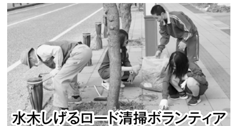
水木しげるロード清掃ボランティア

綿菓子製造機(3回)、ポップコーン製造機(1回)、 氷削機(5回)、テント(2回)