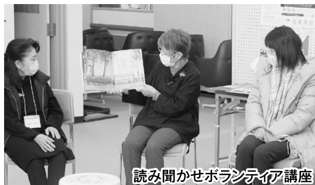
読み聞かせボランティア講座