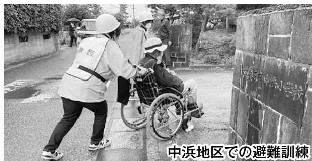
中浜地区での避難訓練