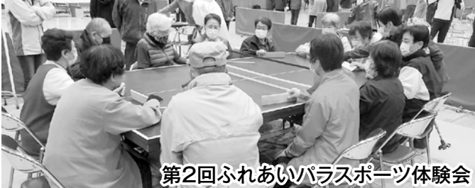
第2回ふれあいパラスポーツ体験会