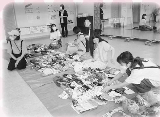
当日は7組の親子が参加され、それぞれお気に入りの服を選んでおられました

※予約制となっておりますので、詳細については 上記の連絡先にお問い合わせください。