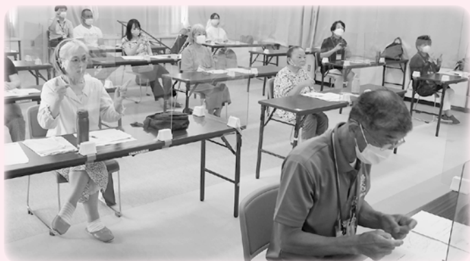
簡単な挨拶や自分の名前を手話で表現しました