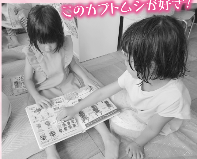
このカブトムシが好き!