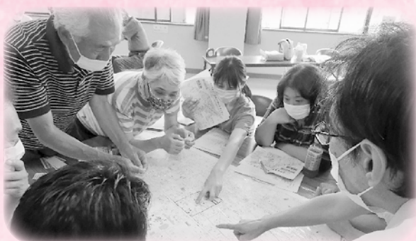
支え愛マップづくりの様子(上道町8区)

境港市社会福祉協議会では、生活支援コーディネーターが「見守り・支え合い」活動の一環として、「支え愛マップづくり」を通じて地域で支え合うことができるまちづくりのお手伝いをしています。