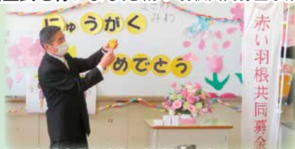
伊達市長より使い方が説明されました

4月11日(火)に行われた渡小学校の入学式終了後に、市民の皆さまからの共同募金を財源として、新入生39名(市内新入生272名)へ防犯ブザーの贈呈式を行いました。境港市共同募金委員会会長・伊達市長より使い方の説明がなされ、「知らない人から声を掛けられ、怖いなぁと思った時は鳴らしてください」との言葉があり、新1年生からは「ありがとうございました」と大きな声でお礼の言葉がありました。