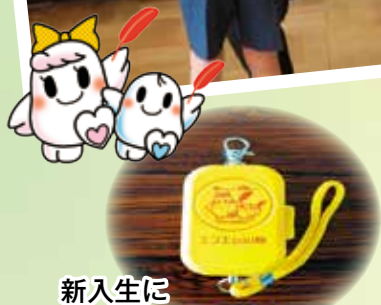
新入生に贈呈された防犯ブザー

皆さまからご寄付いただきました共同募金はこの他にも、児童図書への贈呈、ふれあいパラスポーツ体験会、敬老会、各地区社会福祉協議会の事業などに活用されます。