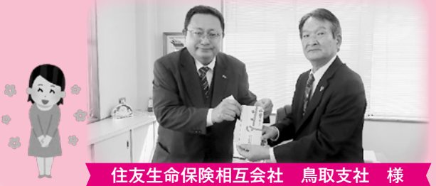
住友生命保険相互会社 鳥取支社 様