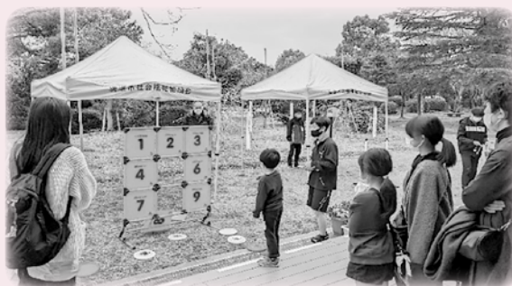
当日は境港市ボランティアセンターを通じて高校生ボランティア11名に活動していただきました。

ほっとはあと福祉イベント実行委員会(境港市、市社協、境港市障がい児(者)育成会、境港市障がい福祉サービス事業所連絡会)の主催で行われたこのイベントには約1,000人の参加があり、多くの方々に賑わいました。