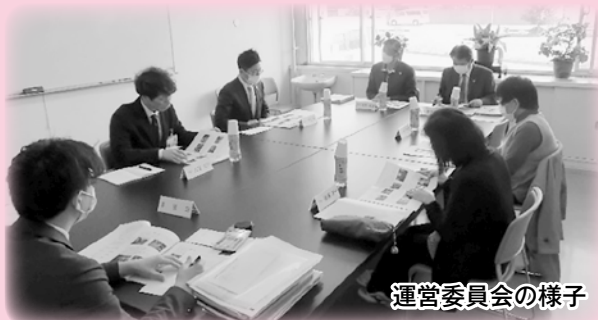
運営委員会の様子

3月28日(火)、浜の里で「令和4年度第2回境港市ボランティアセンター運営委員会」を開催し、出席された運営委員の皆様と令和4年度のボランティアセンター事業について振り返り、令和5年度のボランティアセンター事業などについて意見交換をしました。