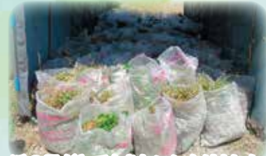
浜の里がとてもきれいになりました。

5月11日(木)、浜の里(老人福祉センター)で境港市老人福祉センター管理運営受託協議会主催の「浜の里応援隊第1回除草ボランティア」が行われました。