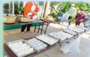
境港市身体障がい者福祉協会の方々より、おにぎりや豚汁が振舞われました。