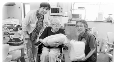
小規模多機能型居宅介護事業所 時の里 様