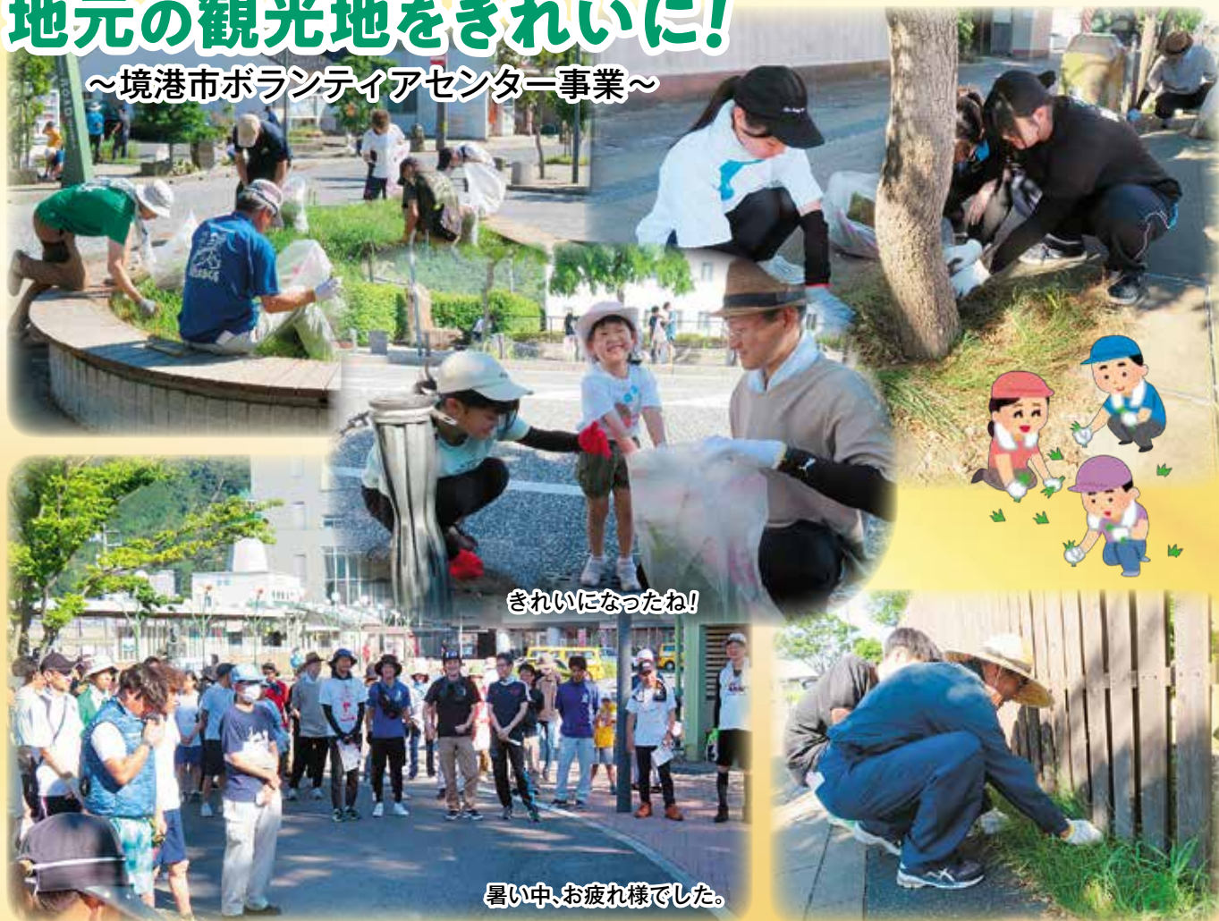
きれいになったね!