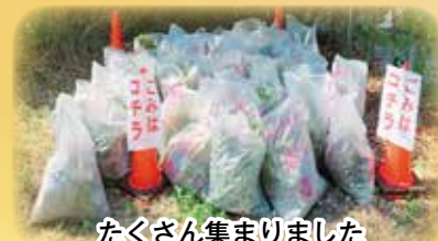
たくさん集まりました