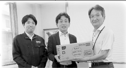
米子空港ビル株式会社 様