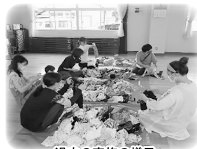
過去の実施の様子