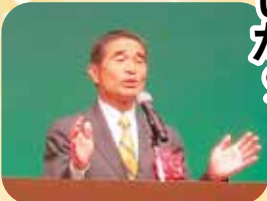
伊達憲太郎 境港市長