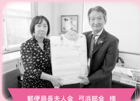
郵便局長夫人会 弓浜部会 様