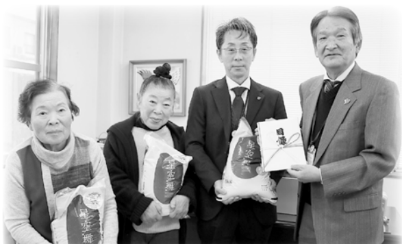
鳥取西部農協女性会境港支部一同様 米ひとつにぎり運動として