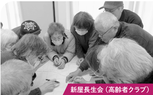
新屋長生会（高齢者クラブ）

渡3区、4区では災害時の避難支援について考える啓発研修会を開催しました。「今後は自治会全体で取り組みについて検討してみる」との感想をいただきました。