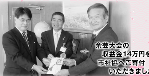
余芸大会の 収益金14万円を 市社協へご寄付 いただきました