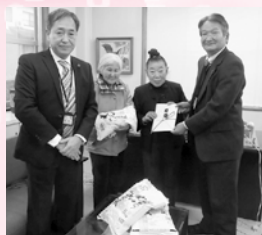
鳥取西部農協女性会 境港支部一同様