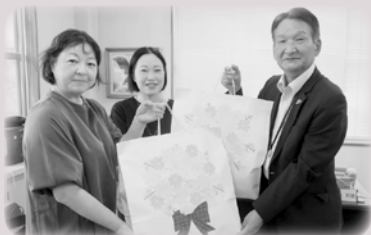
郵便局長婦人会 弓浜部会 様