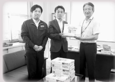
米子空港ビル株式会社 様