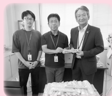
NX境港海陸株式会社 様

広報誌「こだま」への掲載につきましては、寄付者ご本人の了解をいただいております。