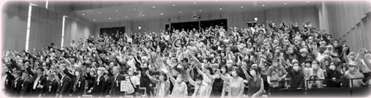
多くの来場者で熱気に包まれる会場