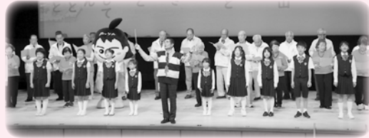
シンフォニー少年少女合唱団と共に

皆様と共に迎えた合唱のフィナーレでは、会場が心温まる歌声や演奏に包まれ、人々が連帯し心を結べばどれほど大きな力となるか、その感動が心に伝わってまいりました。この日を再び活動の原点とし皆様とともにスタートしていきたい、その強い決意が感じられました。