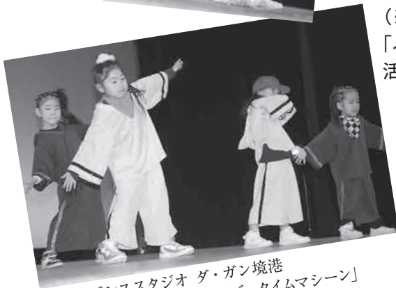
ダンススタジオ ダ・ガン境港 「ダンス・イズ・タイムマシーン」