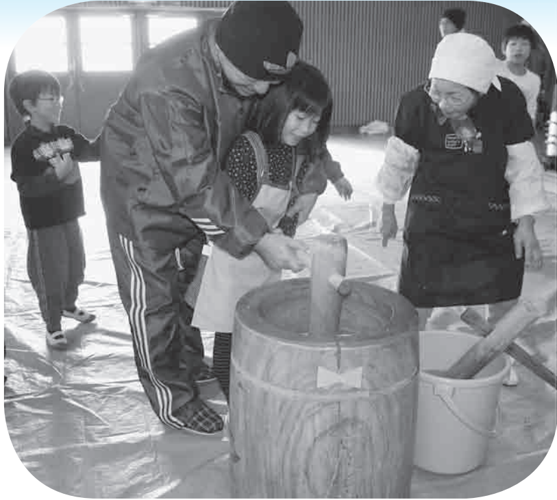
子どもたちにはとても良い経験でした