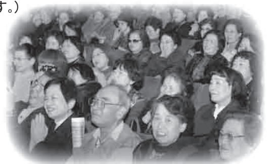
いっぱいの観客に会場も盛り上がりました