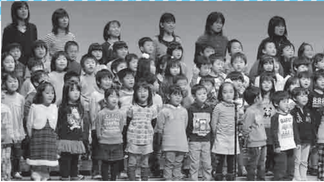
保育所などの園児230人の元気な合唱