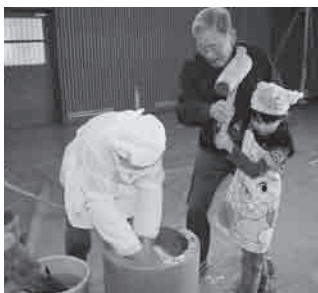
名人に教えてもらいながら杵でもちをつきます