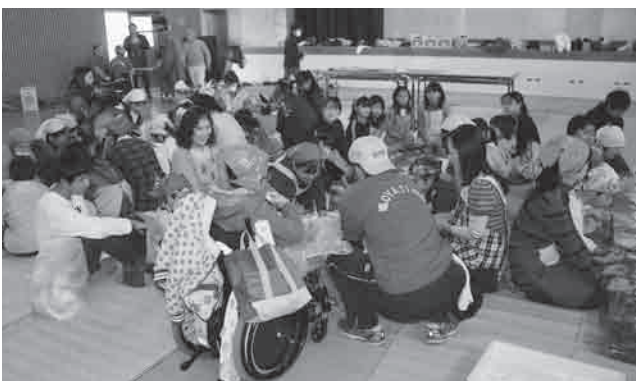
ついたおもちは女性陣にまらめてもらいます