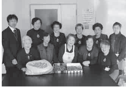
境港市赤十字奉仕団