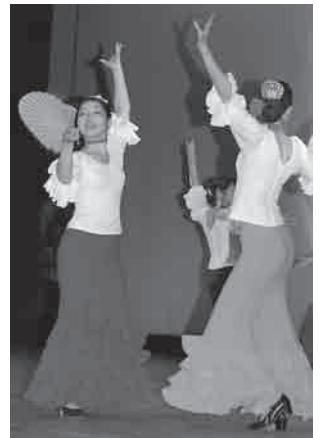
ラ・ノーチェ・フラメンカの情熱的なフラメンコダンス

出演された方、観客のみなさま、スポンサーの方々のご協力、誠にありがとうございました。