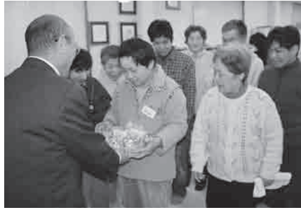
まつぼくり事業所