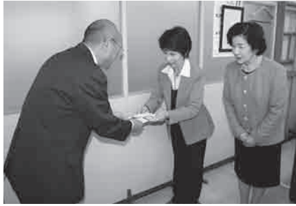
境港商工会議所女性会