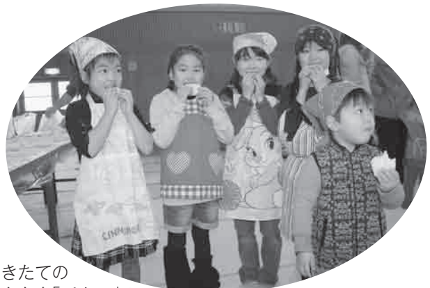
つきたてのおもちを「バクッ！」