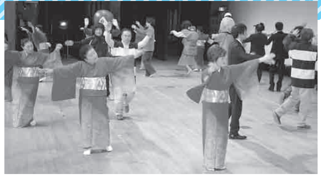
今年大ブレイクした鬼太郎も出演者の輪に加わった「鬼太郎音頭」