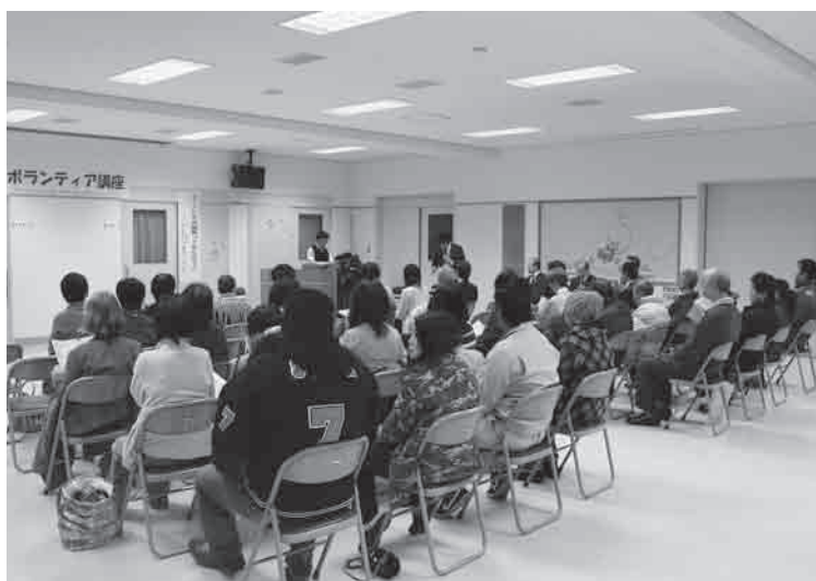
当日は約40名の方が受講されました(会場:境港市保健相談センター)

このほど、境港市社会福祉協議会、境港市、境港市民総合ボランティアセンターが共催し、「ボランティア講座」を開催しました。