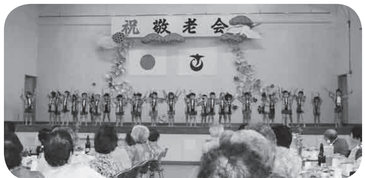
各地区工夫をこらして開催する敬老会