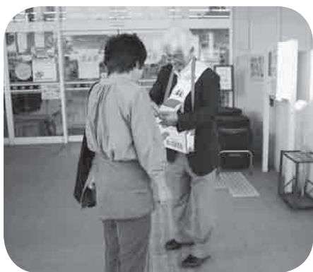
様々なイベントなどでの募金活動

（「地区社協」は、このように、福祉課題やニーズを抱えている方への支援や、地域課題の解決へ向けた地域住民の助け合い推進、住民への協力呼びかけ、啓発活動、関係機関等の連絡調整などが、主な活動になります。）