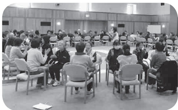
ふれあいの家援助員がレクリエーション研修会に参加