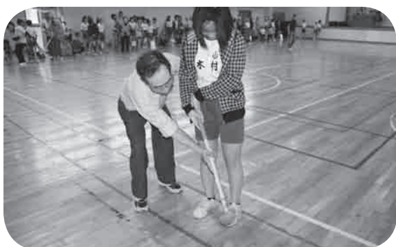
グラウンドゴルフを通しての世代間交流事業

地区社協は、把握したニーズについて話し合い、解決を図りますが、地区内での解決が困難なときには専門機関・組織等と協働します。このように、専門機関や組織、団体等との適切なコーディネートも、地区社協の大切な役割です。