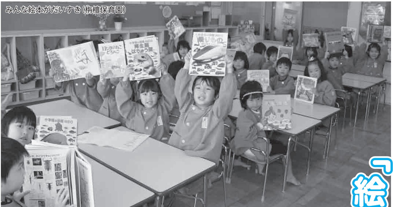
みんな絵本がだいすき(梅檀保育園)