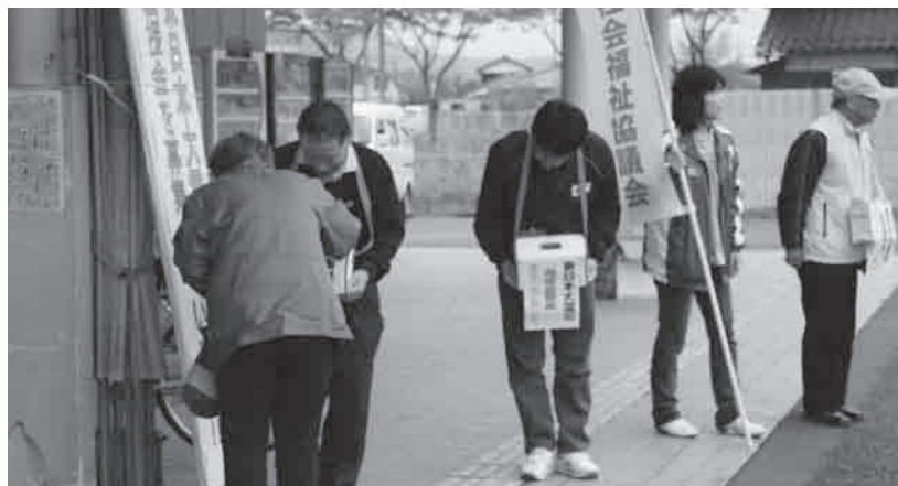
市社会福祉協議会が中心となり実施している街頭募金