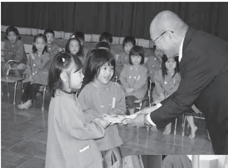
鷗鶴会長より園児代表へ 児童図書購入費を贈呈