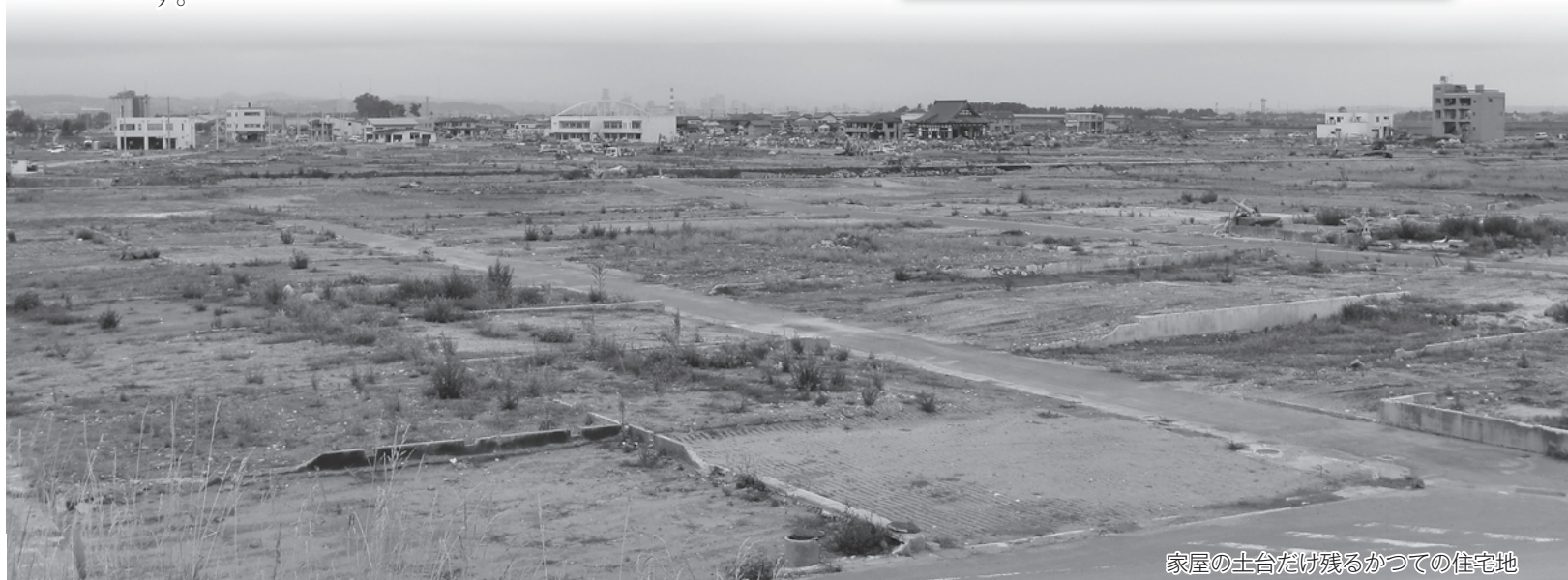
家屋の土台だけ残るかつての住宅地