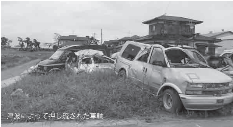
津波によって押し流された車輦

今年3月11日に発生しました東日本大震災では、東北地方に甚大な被害をもたらしました。