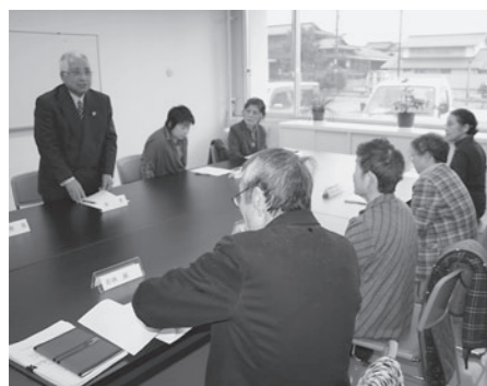
◎福祉モニター会議の様子を抜粋して、掲載させていただきました。

社 防災に関しては市と調整している最中です。おっしゃる通り東日本大震災以降、市民の皆さまの防災意識は非常に高まっています。早急に関係機関と協議を進めていければと思ひます。