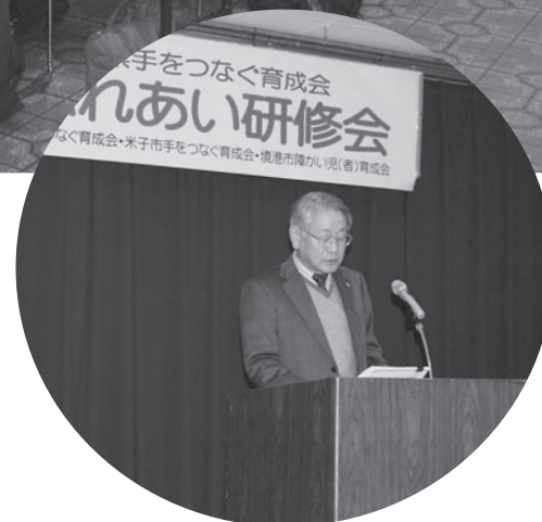
境港市障がい児(者)育成会会長

障がい者の福祉をとりまく状況は大きく変わり、平成25年4月より「障害者自立支援法」から「障害者総合支援法」に改められ施行されます。 このような節目の年に西部地区の育成会が2月20日境港市民会館に約60名集い、「西部地区ふれあい研修会」を開催されました。 午前の部では鳥取県障がい福祉課の足立課長が「障害者総合支援法」について講演し、午後の部では同足立課長がコーディネーター