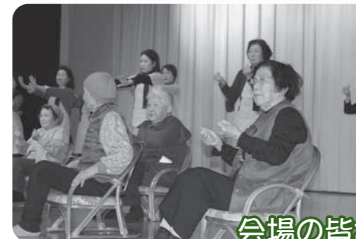
会場の皆さんと一緒に