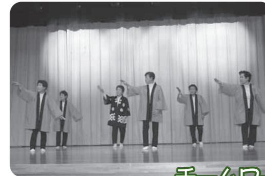
チームワークは1等賞