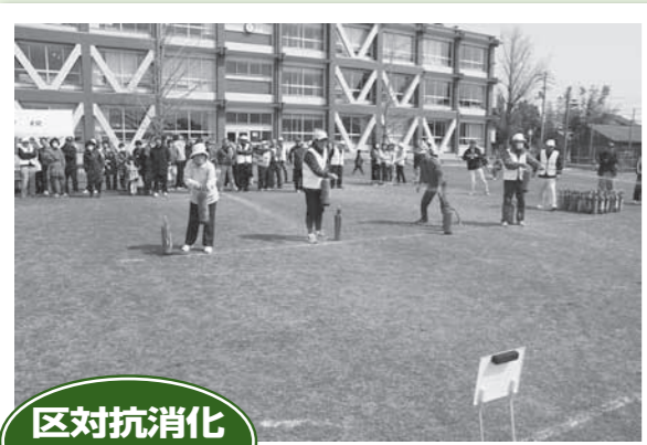
区対抗消防コンテスト

消防署のご厚意により、消防車と起震車の展示があり、子どもたちがたいへん喜んでいました。