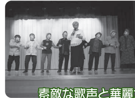
素敵な歌声と華麗なる舞