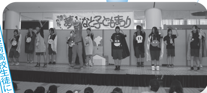
境港総合技術高校生徒によるアンパンマンショー