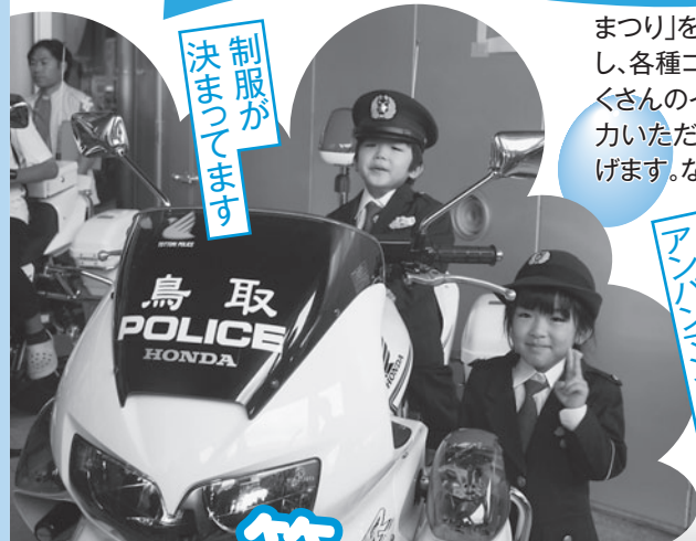
制服が決まっています

未来を担う子ども達の豊かな人間性を育てることを目的に、16回目を迎えた「夢みなと子どもまつり」を7月7日に夢みなとタワーを中心に開催し、親子ら約2,500人が来場し、各種コーナーで交流しました。参加した子ども達は元気いっぱい、盛りだくさんのイベントを満喫していました。ご来場いただきました市民の方々、ご協力いただきました各参加団体、後援団体、協力団体のみなさまに感謝を申し上げます。なお、この事業は共同募金配分金を受けて実施しています。