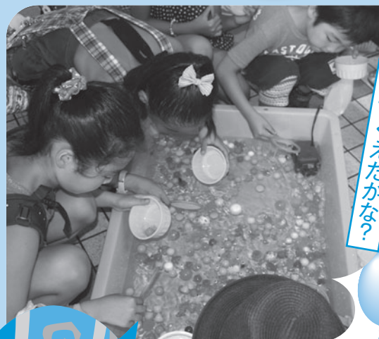
うまくすくえたかな?