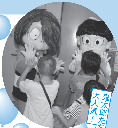
鬼太郎たちも大人気!