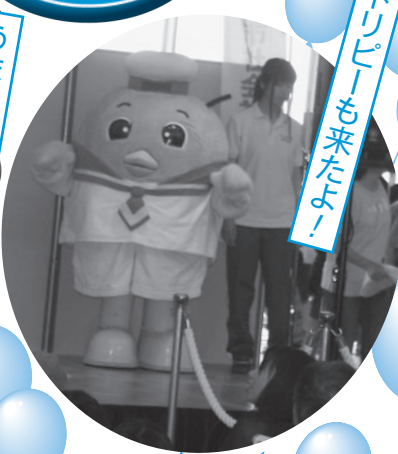
トリピーも来たよ!