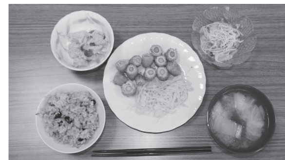
アスパラの豚肉巻きフライなど5品

「各地区援助員同士の交流の場にもなっているので、これからも研修会を続けてもらいたい」との感想が寄せられました。