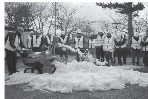
除雪車を操作し、除雪作業の練習をしました

参加者は出陣式終了後に、公民館横の駐車場へ出て除雪車の操作を体験しました。駐車場には大山から運んだ真っ白な雪が準備されており、除雪隊員が交代で除雪していきました。巧みに操作するその勇姿から「我が地区の住民を守る」との使命感が伝わってきました。参加者からは「少しでも地域住民の力になればと思う」との声がありました。