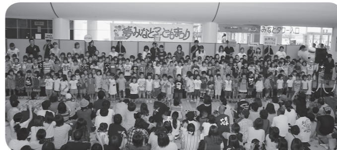
夢みなと子どもまつりの開催