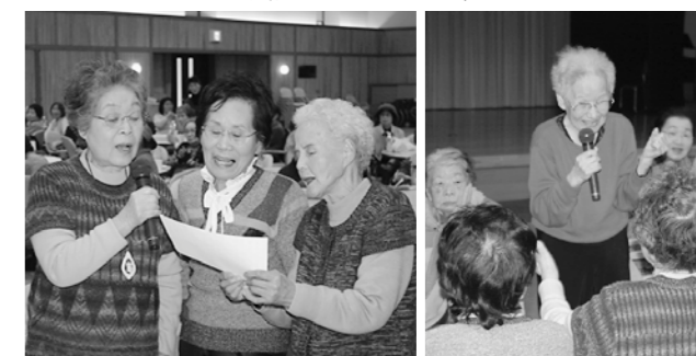
会場の皆さんと一緒に