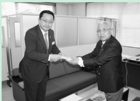
住友生命保険相互会社 様