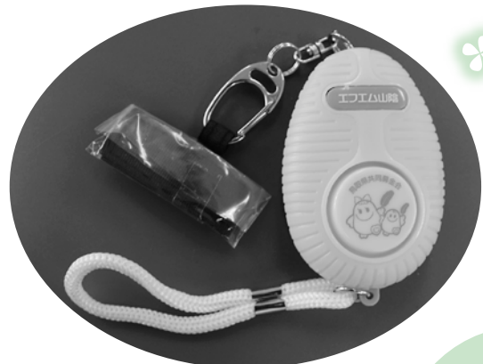
新入生に贈呈された防犯ブザー

皆さまからご寄付いただきました共同募金は、様々な事業実施のために使われています。