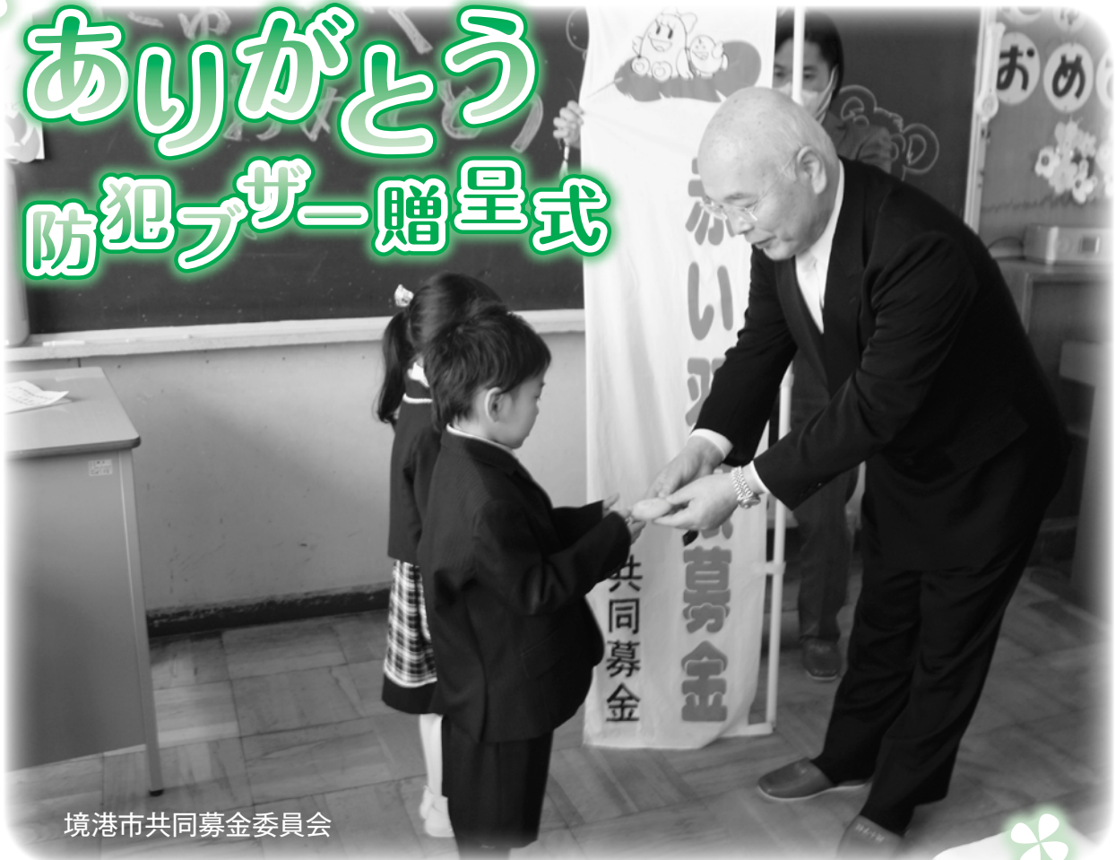
境港市共同募金委員会

4月9日に行われた渡小学校の入学式終了後に、市民の皆さまからの共同募金を使って、新入生54名へ防犯ブザーの贈呈式を行いました。