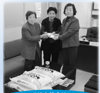
鳥取西部農協女性会境港支部 様