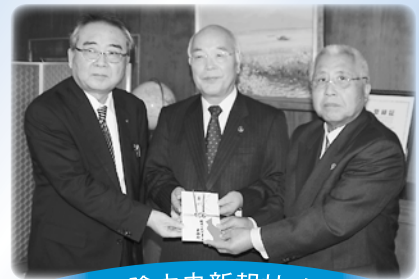
山陰中央新報社 様