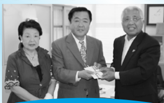
港ベンチャーズ 様