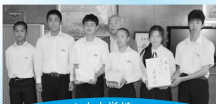
境港市内中学校一同 様