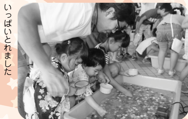
いっぱいとれました