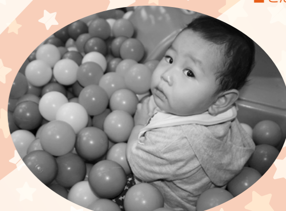
ボールプールはきもちいいね