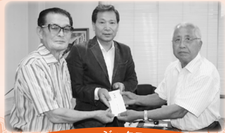
オールミュージックユニオン様