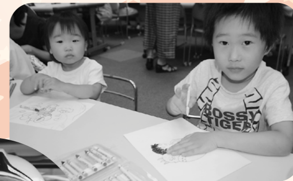
うまくかけたかな