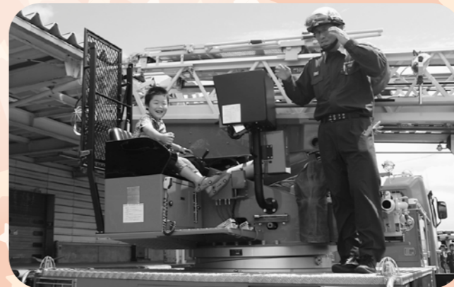
消防車両に乗ったよ