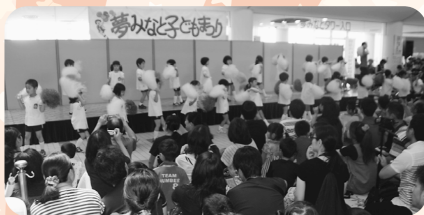
聖心幼稚園の園児がかわいい踊りを披露しました