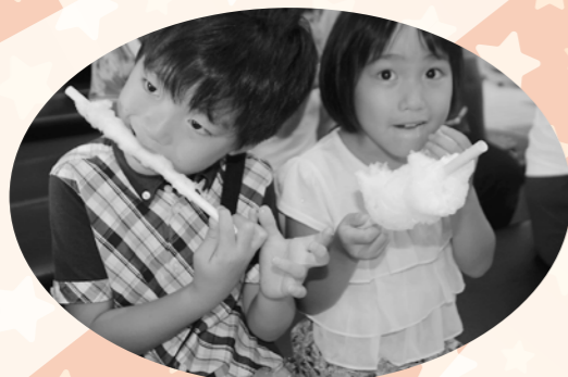
綿菓子もおいしいよ