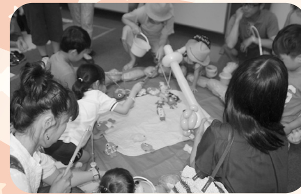
みんなでさかなつり