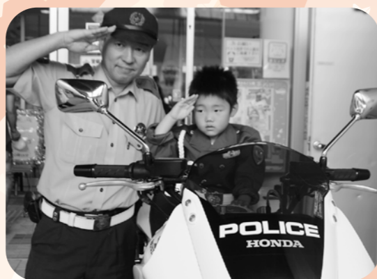
白バイに乗りました