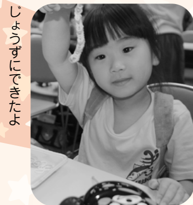
じょうけいぶがきたたけ