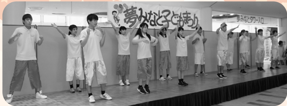
境港総合技術高校の生徒による楽しいステージ