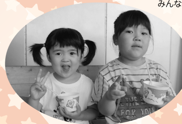
かき氷はおいしいな