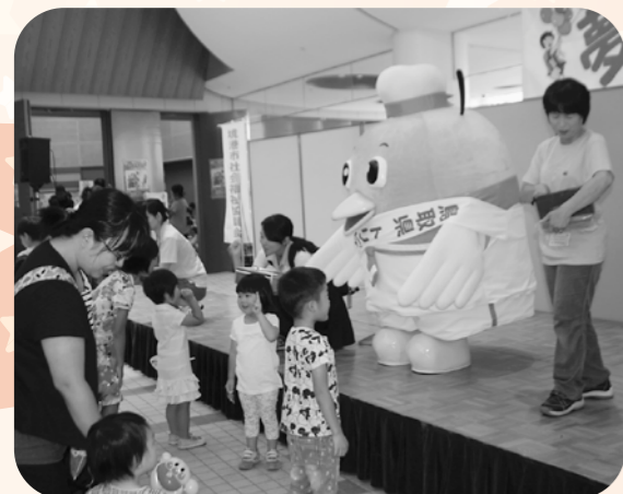
トリピーとのじゃんけん大会