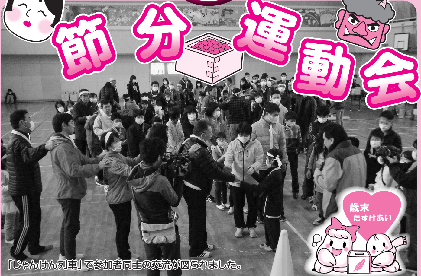
「じゃんけん列車」で参加者同士の交流が図られました。