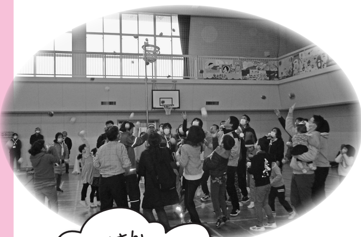
上手にたくさん入ったかな (玉入れ)

今年で十五回目を迎えたまつぼっくり事業所の利用者と余子小学校の児童たち、保護者などによる節分運動会が余子小学校で二月二十九日行われました。参加者は約二百名で「じゃんけん列車」や「玉入れ」、「綱引き」や「風船運び」を楽しみ、後半では「鬼は〜外、福は〜内」との元気な掛け声とともに、ステージ上に現れた鬼に向かって豆を投げました。最後は参加者全員で記念写真を撮りました。参加者からは「今年も元気に楽しく参加できました。来年も参加したいです。」との声をいただきました。 この運動会は余子地区社会福祉協議会が歳末たすけあい事業助成金を受けて実施しました。