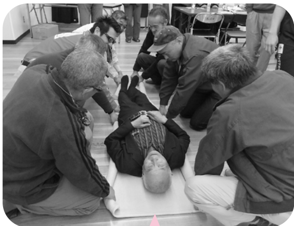
毛布1枚あれば人を搬送できることを学びました