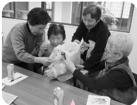
実際にやってみました。「簡単にできるよ」