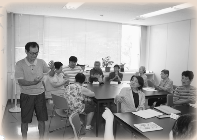
学習会の様子：参加者で楽しく学びます

8月2日に浜の里（老人福祉センター）で「さかいみなと手話学習会」が「西部ろうあ仲間サロン会」のメンバーと第1回目の勉強会を開催しました。名前や住所、趣味などの手話を学び合いました。参加者からは「緊張したけど、とても楽しかったです。次回の9月6日が楽しみです」との声をいただきました。