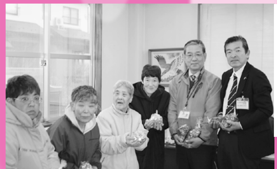
まつぼっくり事業所様