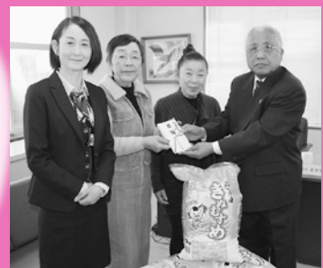
鳥取西部農協女性会境港支部 様