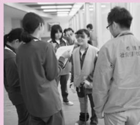
高齢者介助の問題点を話し合いました

体験を終えた生徒からは、「装具をつけると手先もうまく使えず、視界も悪くなり、手足が重くなって自由に動かせなかった。高齢者の立場に立った支援ができるようこの経験を活かしていきたい。」との感想が寄せられました。