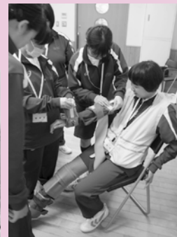
みんなで協力して装具をつけました