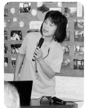
志賀生活支援 コーディネーター

境港市社会福祉協議会では地域づくりのひとつとして「支え愛マップづくり」のお手伝いをしています。我が地域でもと思われましたらお気軽にご連絡ください。