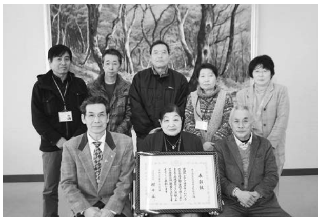
余子地区民生児童委員協議会