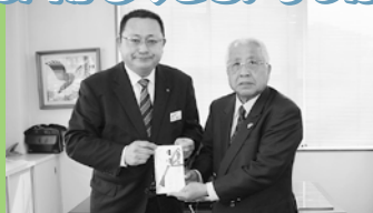
住友生命保険相互会社 様