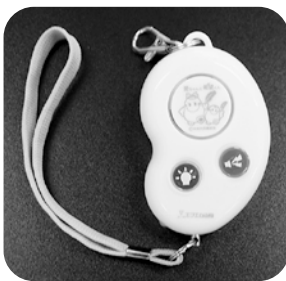
新生児に贈呈された防犯ブザー

4月9日に行われた上道小学校の入学式終了後に、市民の皆さまからの共同募金を使って、新生児44名（市内新生児278名全員）へ防犯ブザーの贈呈式を行いました。