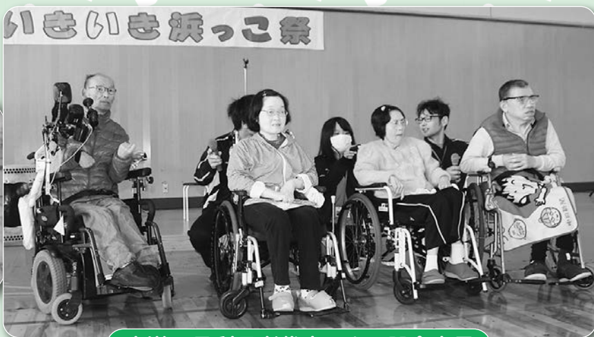
光洋の里利用者代表による開会宣言