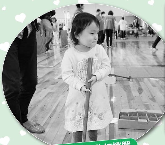
スカットボールに挑戦

「いきいき浜っこ祭」が境港第2市民体育館で行われ、約1,000名の参加者が楽しく交流しました。この祭りは障がいのあるなしに関わらず互いの交流と絆を深め、福祉意識の高揚を図ることを目的に今年で39回目となりました。特設ステージでは聖心幼稚園の園児による鼓隊演奏、まつぼっくり事業所の利用者による「まつぼっくり太鼓」が披露され、境港総合技術高等学校福祉科の生徒の皆さんがダンスで会場を盛り上げました。ファイナルでは「じゃんけん☆ふれあい列車」による参加者同士の交流が行われ、最後は大きな人の輪を作って「さかいみなと手話学習会」のメンバーを中心に、手話をまじえた「ふるさと」の合唱で締めくくられました。