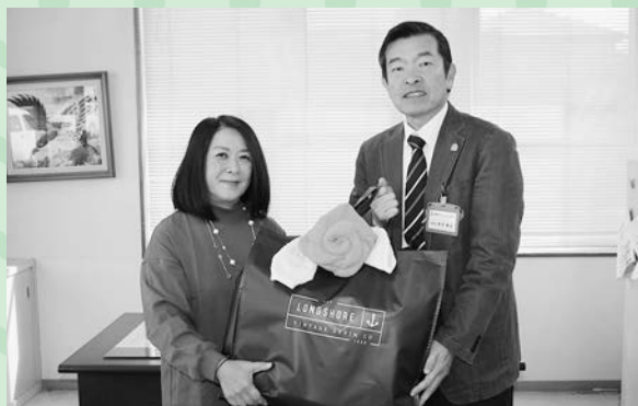
郵便局長夫人会弓浜部会 様