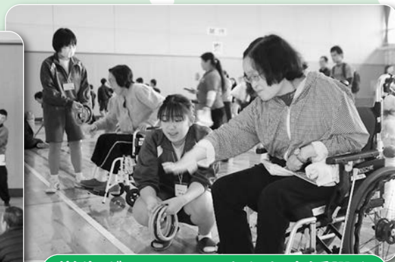
学生ボランティアさんも大活躍♪