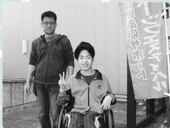
鳥取県あいサポートフェスティバルも同時開催♪