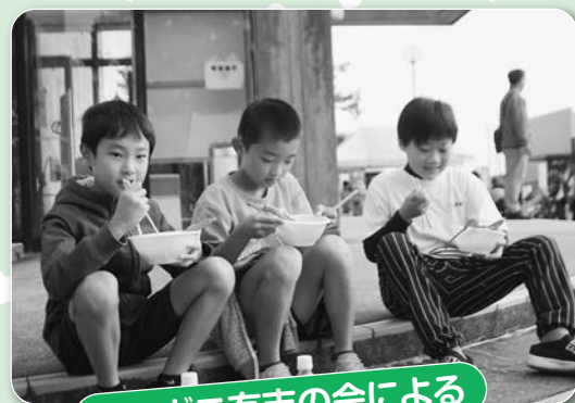
ベニガニ有志の会による カニ汁のふるまい