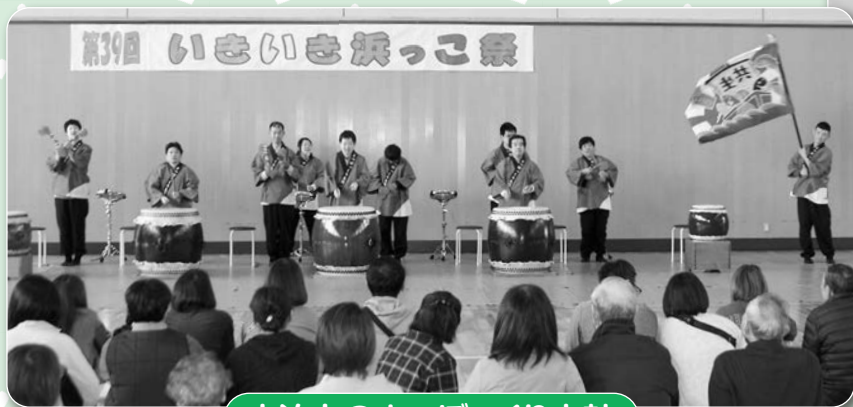
大迫力のまつぼっくり太鼓