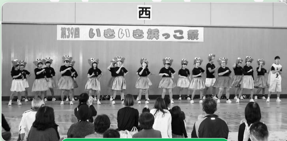
高校生による楽しいダンスステージ