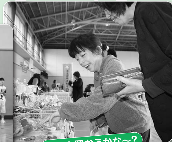
なにを買おうかな～？