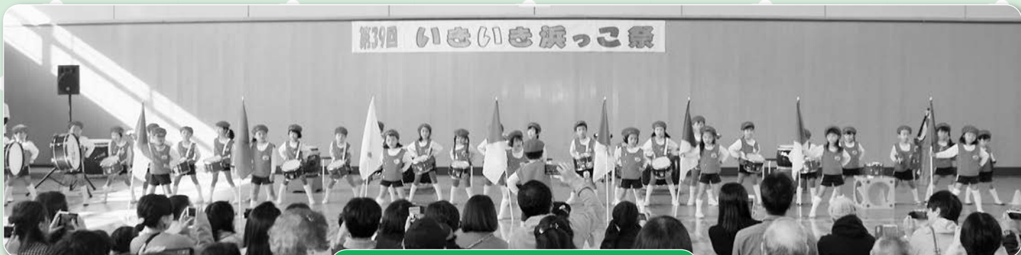
聖心幼稚園の園児による鼓隊演奏