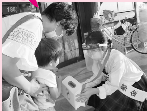
境港総合技術高校の生徒もボランティアとして活躍!