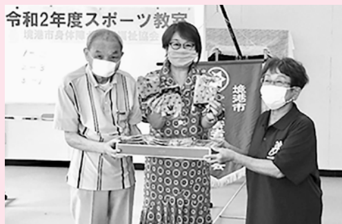
素敵なマスクのプレゼント♪