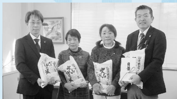
鳥取西部農協女性会境港支部 様