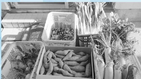
余子公民館・農業塾 様