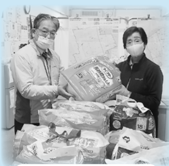
中浜ケアパートナーズ 様