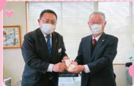
住友生命保険相互会社 鳥取支社 様