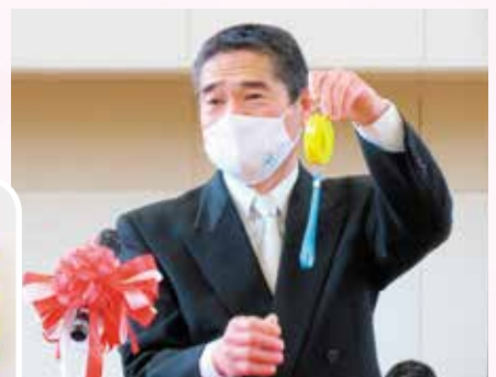
伊達市長より使い方が説明されました