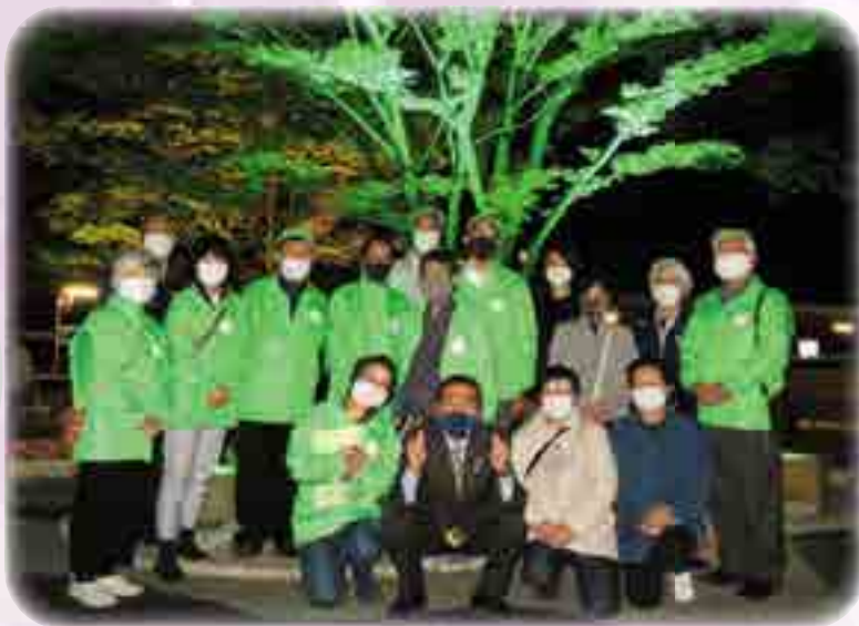
境地区民生児童委員協議会の皆さんと伊達市長さん