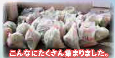
こんなにたくさん集まりました。