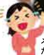
メンバーが「バナナのたたき売り」を披露!!