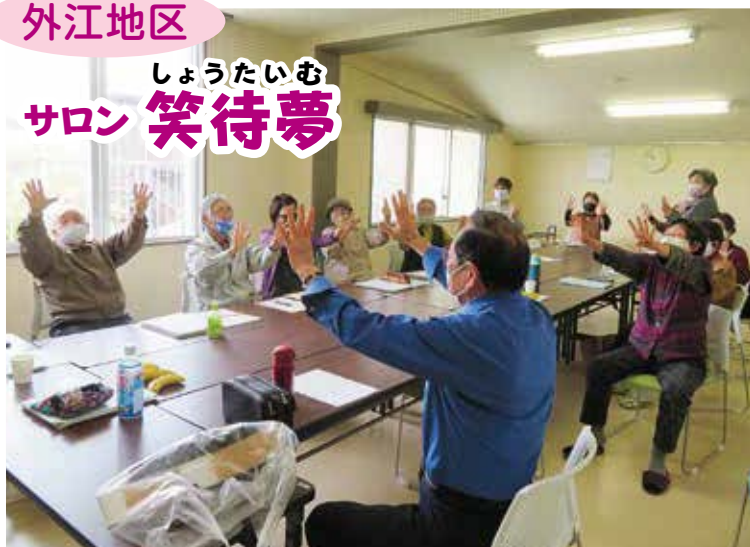
みんなで楽しみながらフレイル予防にも取り組んでいます!!