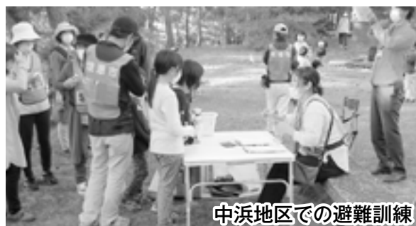
中浜地区での避難訓練