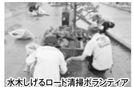
水木しげるロード清掃ボランティア

綿菓子製造機(9回)、ポップコーン製造機(4回)、氷削機(3回)、テント(ワンタッチ)(1回)