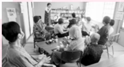
ドレミの歌で交流♪手拍子や口ずさむ人も…