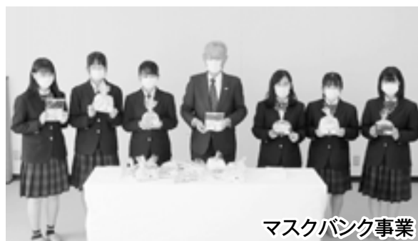
マスクバンク事業