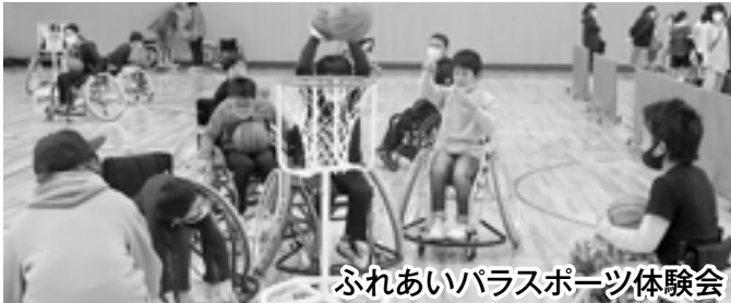
ふれあいパラスポーツ体験会