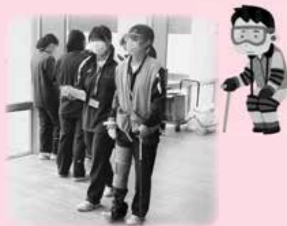
高齢者の気持ちになって歩いてみます。

体験を終えた生徒からは、「装具をつけると、視界が悪くなり歩きにくく、手先もうまく使えず、普段は簡単にできることが難しかった。この経験を活かして、高齢者の立場に立った支援ができるよう学んでいきたい」との感想がありました。