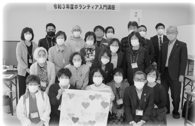
それぞれの想いをハート型の折り紙に綴りました