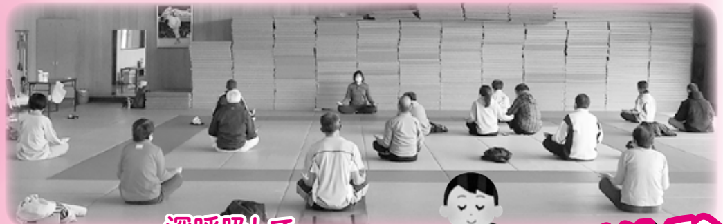
深呼吸して リラックス