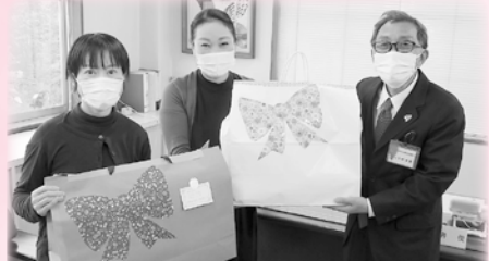
郵便局長夫人会 弓浜部会 様