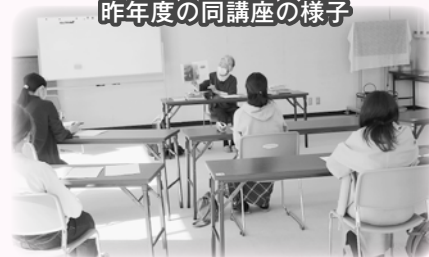
昨年度の同講座の様子