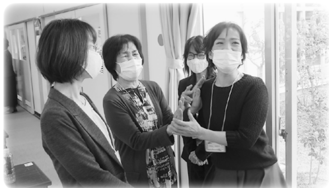
レクリエーションを通じて交流を楽しみました