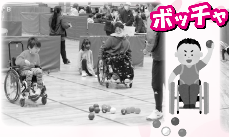
高校生がボッチャに初挑戦!

県西部の境港市で開催することで、境港市民を中心に障がいの有無を問わず、気軽にパラスポーツを体験していただき、パラスポーツを知っている人、サポーターになってくれる人を増やし、パラスポーツへの理解を深めることを目的としています。