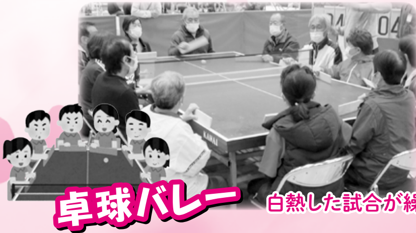
白熱した試合が繰り広げられました